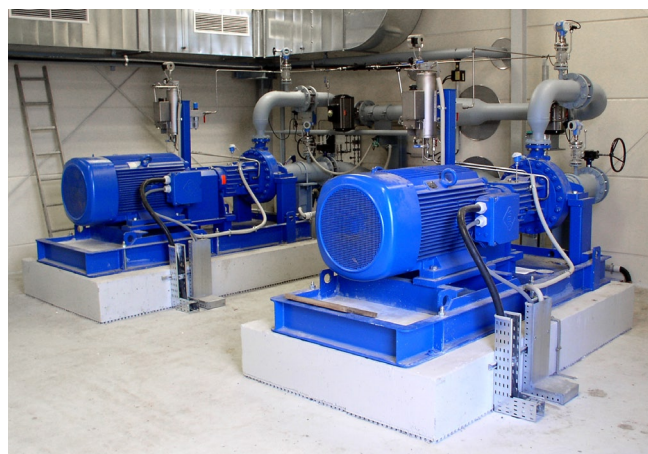
Transportpumpen für den Solbetrieb

Über 40 Kilometer lang ist die Rohrleitung, mit der die in Empelde anfallende Sole nach Sehnde gepumpt wird. Die Transportleitung wurde 2004 gebaut und entlang einer bestehenden Erdgasleitung unterirdisch verlegt. Nach Abschluss der Solarbeiten kann diese Leitung zum Erdgastransport dienen. Die Sole wird von Empelde über die erdverlegte Stahlrohrleitung bis nach Sehnde zum Bergwerk Bergmannsseggen-Hugo transportiert. Über 4,3 Millionen Kubikmeter Sole aus Empelde stabilisieren schon dort inzwischen die Hohlräume des ehemaligen Kalisalzbergwerks.